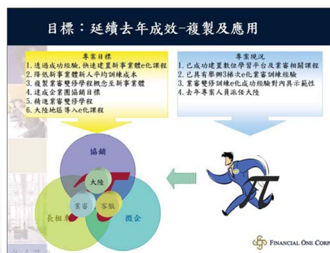
中租e學苑示範效益圖

本次數位學習專案的主軸「中租企業團數位學習整合計劃」除延續95年「中租π型人養成計劃」的發展成效，並朝向擴充數位學習平台成效到新事業體、海外據點上，且透過企業團學習資源的整合，規劃企業團協銷課程，提高協銷成果。