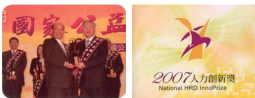
行政院勞工委員會主辦2007人力創新獎頒獎典禮 新光人壽勇奪「團體獎」與「個人獎」雙料殊榮