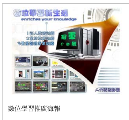
數位學習推廣海報