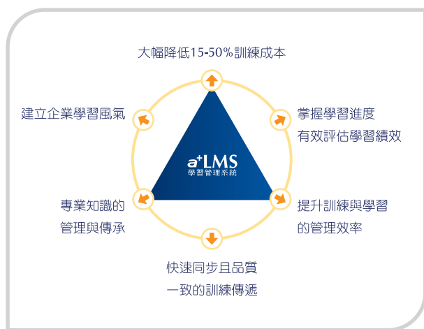
▲ a+LMS 主要應用效益