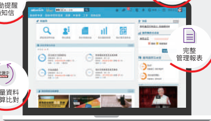
▲ 育基「a+TCR金融訓練通報預警模組」