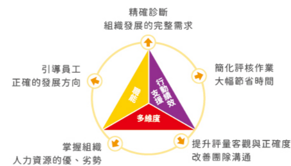
a+MRA Suite 主要應用效益